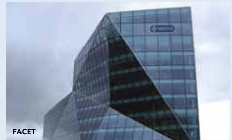
www.tibarchitecten.nl - 39.000 m 2