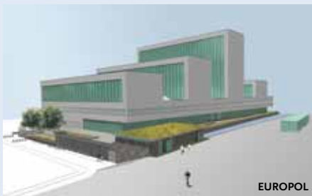
www.qwa.nl - 32.000 m 2