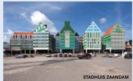
www.soetersvaneldonk.nl - 31.500 m 2

Sjoerd Soeters en Jos van Eldonk hebben een naam opgebouwd met grote en spraakmakende stedelijke herstructureringsplannen in Nederland en recent ook in Denemarken. Zo werken ze op dit moment aan een herstelplan voor het centrum van Zaanstad met een inventieve en deels opgetilde route naar en over het bestaande spoor. Naast gebouwen in Ede en Veenendaal telt vooral het nieuwgebouwde stadhuis van Zaanstad mee in het bereiken van dit grote totaaloppervlak.